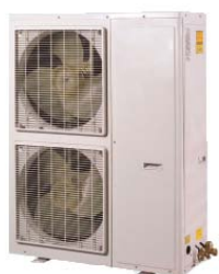
3,5HP, 4HP, 5HP, 6HP

Комбинируя наружные блоки можно подобрать необходимую холодопроизводительность от 10 кВт до 180 кВт. Для достижения высокой экономичности систем в блоках установлены DC-инвертерные компрессоры.